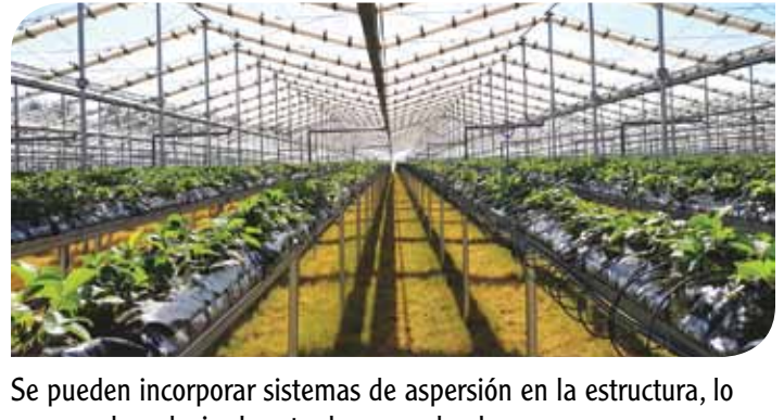
Se pueden incorporar sistemas de aspersión en la estructura, lo que puede reducir el costo de mano de obra.

Contacte Cravo si desea ver por sí mismo lo fácil que es el manejo de hectáreas de producción de berries de manera más rentable utilizando el sistema de producción de techos retráctiles de Cravo.