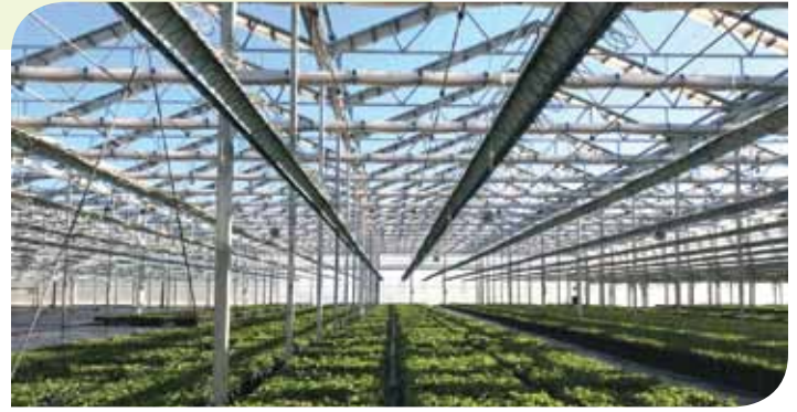
Los techos retráctiles también se pueden usar para mejorar la producción de cultivos que crecen en el suelo.