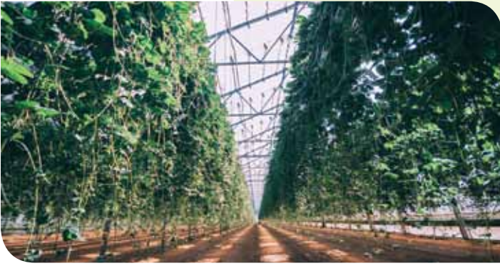
Producción de fresas con múltiples capas.