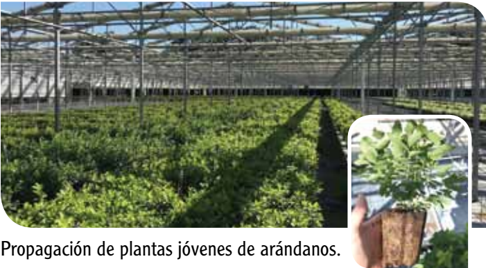
Propagación de plantas jóvenes de arándanos.