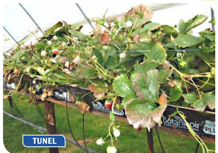
Fotos tomadas el 11 de septiembre en Reino Unido en la misma finca. Túnel convencional a la derecha y techo retráctil a la izquierda.