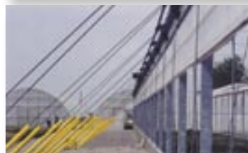
Los tirantes de los postes laterales su pueden colocar en el interior o en el exterior