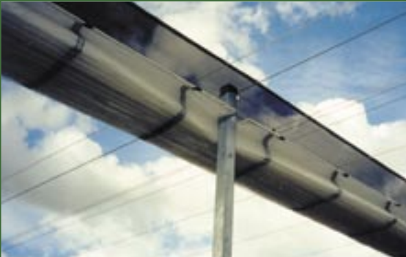
Prolongar la vida del techo usando un pabellón opcional